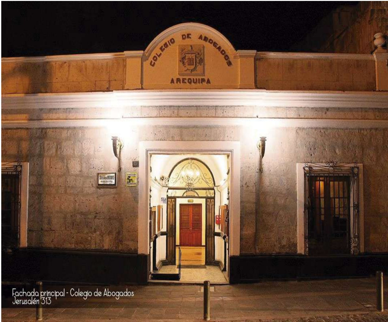
Fachada principal - Colegio de Abogados Jerusalén 313